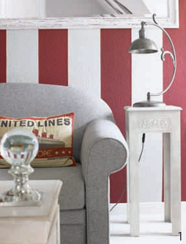
1 KONTRASTE Rot und Grau statt Blau und Weiß – diese Einrichtung wirkt auf erfrischende Weise leicht und zeitlos. 2 NATURTALENT Inneneinrichter Dirk Reimers hat sein Zimmer schon in jungen Jahren immer wieder gerne umgeräumt.